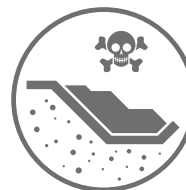
SKŁADOWISKA ODPADÓW STAŁYCH