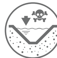
ZBIORNIKI ODPADÓW CIEKŁYCH